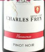
フレイ ピノ・ノワール・ アルモニ 2018