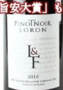
ロロン ピノ・ノワール 2017

隠れた名産地・ オーヴェルニュ産ピノ・ノワール 過去にはリアルワインガイド 「旨安大賞」も受賞