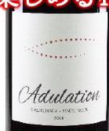
アデュレーション ピノ・ノワール 2016