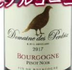
ペルドリ ブルゴーニュ・ ピノ・ノワール 2017