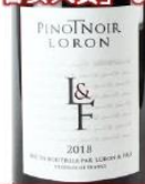
ロロン ピノ・ノワール 2017

隠れた名産地・ オーヴェルニュ産ピノノワール 過去にはリアルワインガイド 「旨安大賞」も受賞