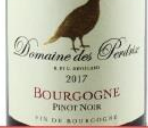
ペルドリ ブルゴーニュ・ ピノ・ノワール 2017