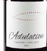
アデュレーション ピノ・ノワール 2016